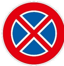
Figura II 75 Art. 120

per le necessità di cantiere e di disciplina degli spazi riguardanti l'istituzione transitoria dei doppi sensi di circolazione